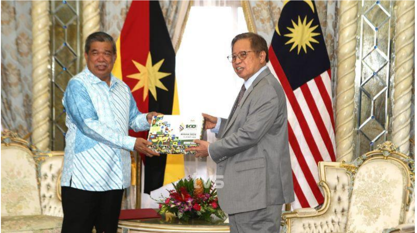
Datuk Seri Mohamad Sabu mengetuai delegasi Kementerian Pertanian, dan Kerjaminan Makanan mengadakan kunjungan hormat kepada Premier Sarawak, Datuk Patinggi Tan Sri Abang Johari Tun Openg di Wisma Bapa Malaysia, di sini, hari ini.

KUCHING, 1 Ogos: Stesen Kerbau Meragang Lawas berpotensi sebagai kawasan penternakan kerbau contoh di peringkat nasional, kata Menteri Pertanian dan Keterjaminan Makanan, Datuk Seri Mohamad Sabu.