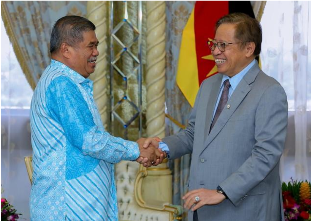
Abang Johari (kanan) menerima kunjungan hormat Mohamad di Wisma Bapa Malaysia, Petra Jaya, hari ini.

KUCHING: Kementerian Pertanian dan Keterjaminan Makanan (KPKM) akan mengadakan lawatan ke ladang ternakan kerbau di Meragang, Lawas, di bahagian utara Sarawak sempena Jelajah Pameran Pertanian, Hortikultur dan Pelancongan Malaysia (MAHA) 2024 pada 8 hingga 11 Ogos ini.