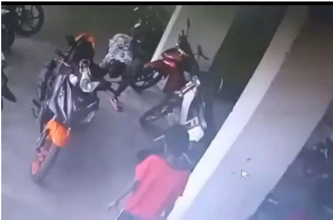
Jabatan Perkhidmatan Veterina (DVS) Selangor menyiasat kes kucing dibakar di Flat Sungai Kenari, Sungai Ramal Baru Kajang mengikut Akta Kebajikan Haiwan 2015 (Akta 772).

PUTRAJAYA, 2 MEI: Jabatan Perkhidmatan Veterinar (DVS) Selangor membuka kertas siasatan berhubung kes kucing dibakar di Flat Sungai Kenari, Sungai Ramal Baru, Kajang, dekat sini, pada 22 April lepas.