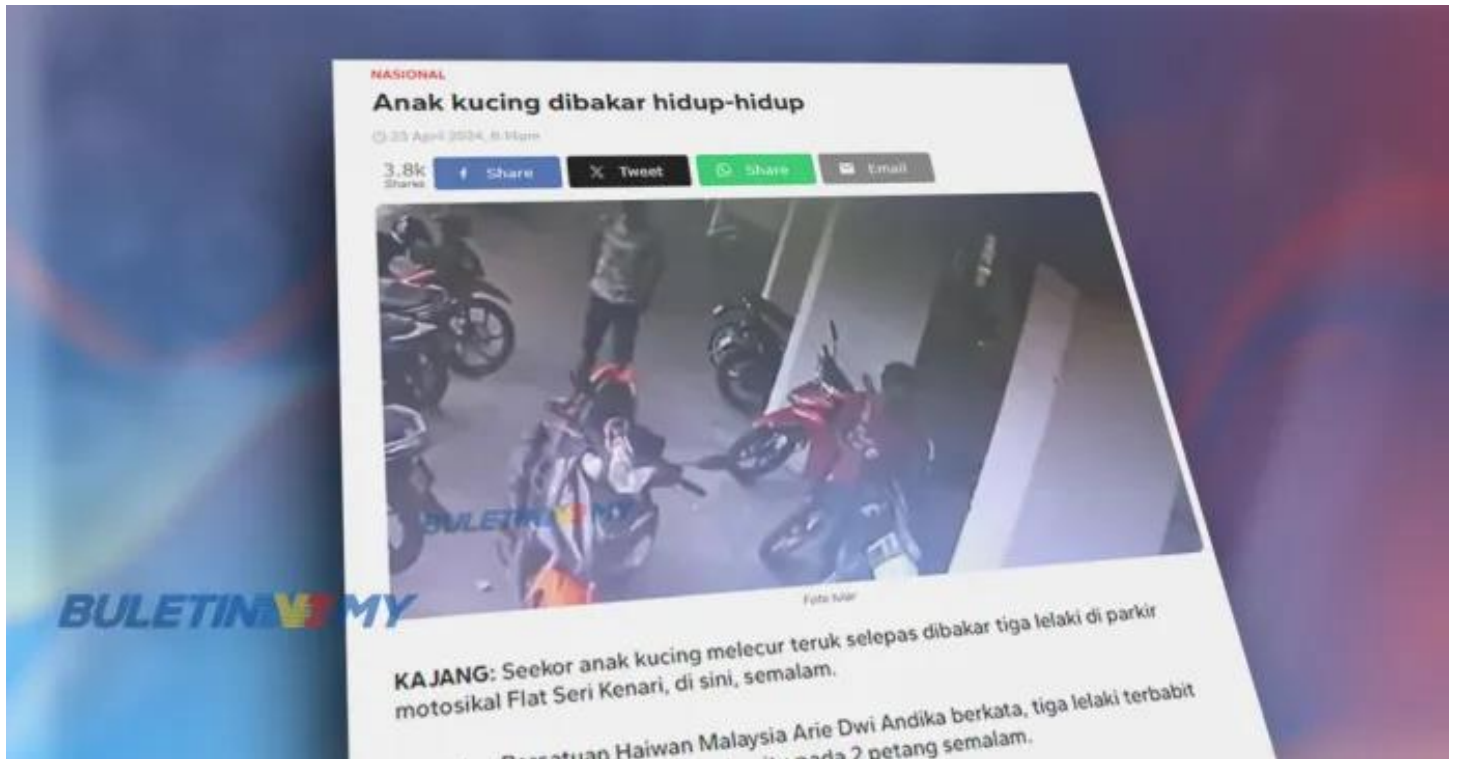
Mohamad Sabu berucap merasmikan majlis Perasmian Simposium Pengembangan Subsektor Tanaman Jabatan Pertanian Tahun 2024, hari ini.

PUTRAJAYA: Jabatan Perkhidmatan Veterinar (DVS) Selangor telah membuka kertas siasatan berhubung kes kucing dibakar di Flat Sungai Kenari, Sungai Ramal Baru, Kajang pada 22 April lalu.