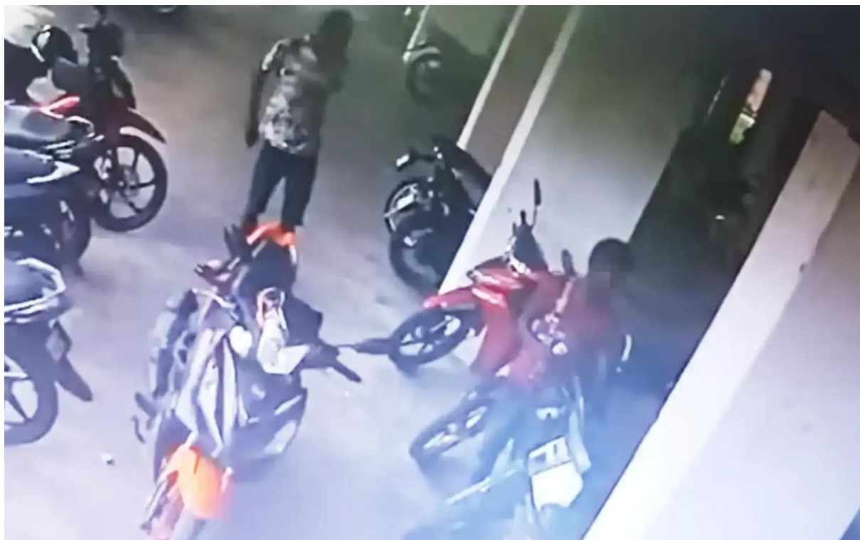
Sebelum ini, tular satu rakaman video menunjukkan dua daripada tiga lelaki menyimbah bahan bakar sebelum menyalakan api pada anak kucing di sebuah flat di Kajang.

PUTRAJAYA: Jabatan Perkhidmatan Veterinar (JPV) Selangor membuka kertas siasatan berhubung kes kucing dibakar di Flat Sungai Kenari, Sungai Ramal Baru, Kajang, dekat sini, pada 22 April lepas.