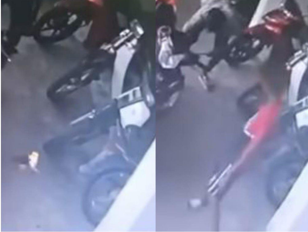
Rakaman CCTV menunjukkan sekumpulan lelaki bertindak membakar seekor anak kucing hidup-hidup.

PUTRAJAYA – Jabatan Perkhidmatan Veterinar (DVS) Selangor telah membuka kertas siasatan berhubung kes kucing dibakar di Flat Sungai Kenari, Sungai Ramal Baru, Kajang, Selangor pada 22 April lepas.