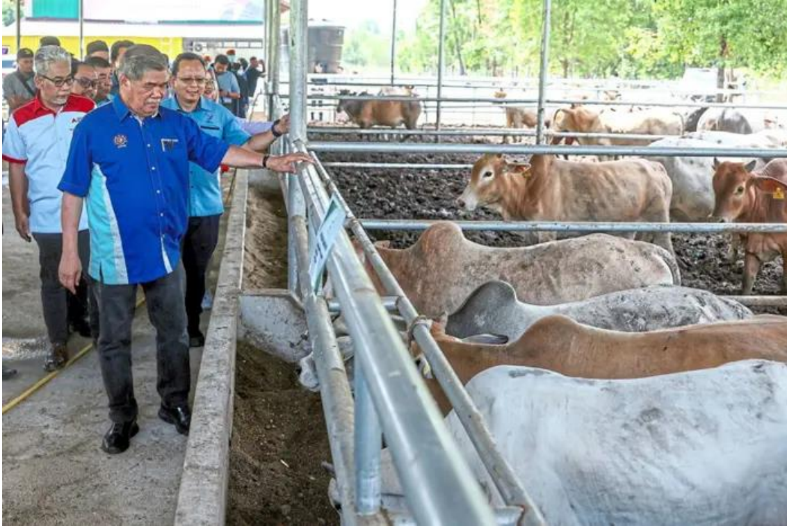
Farm visit: Mohamad visiting one of the cattle farms after the opening of HL Agro Farm KB Sdn Bhd yesterday.

BACHOK: Malaysia still needs 200,000 tonnes of beef per year to meet the needs of the people, says Datuk Seri Mohamad Sabu.