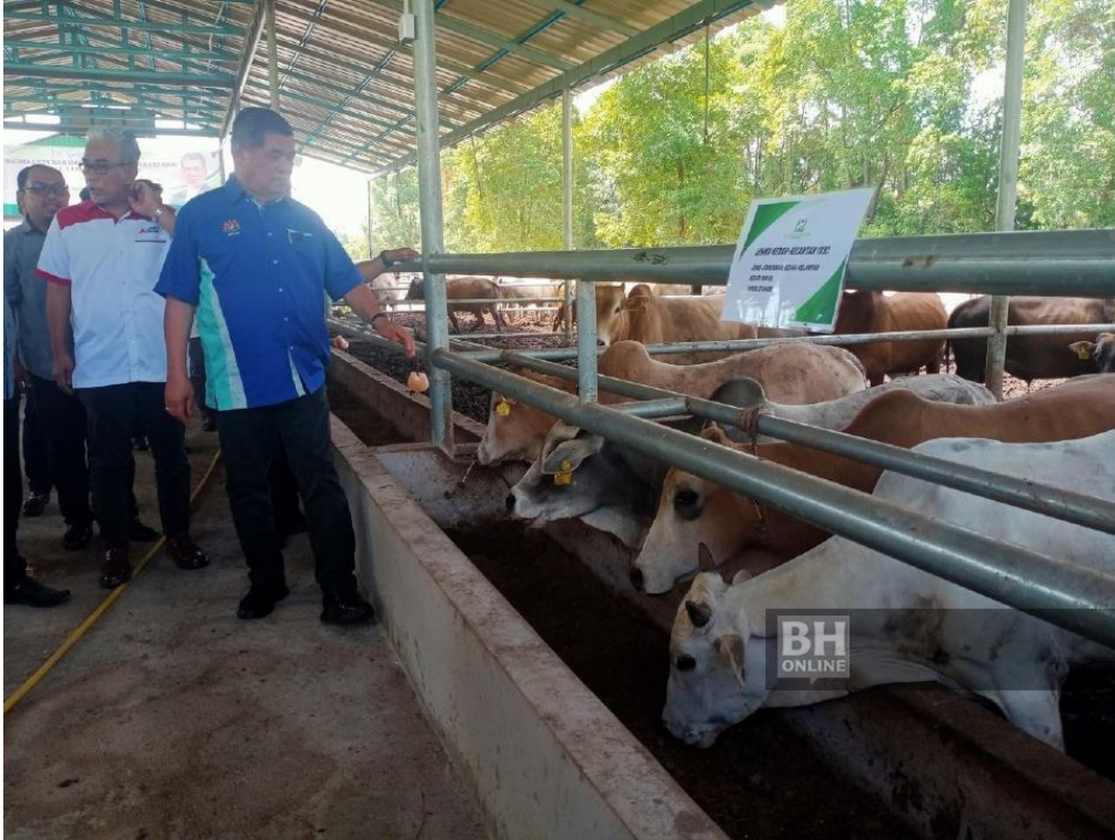
Mohamad (tengah) ketika melawat kandang lembu sempena Majlis Latihan kerja Rasmi dan Perasmian HL Agro Farm KB Sdn Bhd Bersama Komuniti Penternak dan Peladang Kelantan 2024 di Kampung Sri Kemunting, Gunong, Bachok.

BACHOK: Harga lembu untuk ibadah korban masih sama seperti harga tahun lalu, kata Menteri Pertanian dan Keterjaminan Makanan, Datuk Seri Mohamad Sabu.