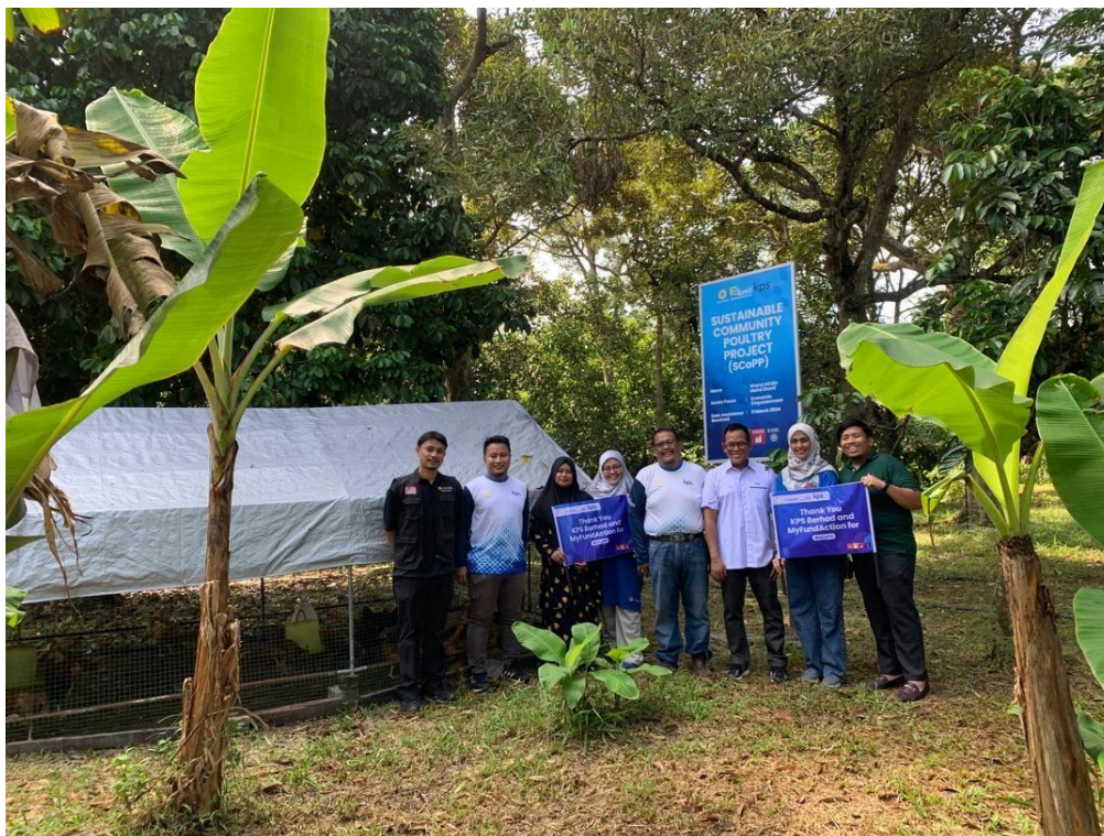
Pihak KPS Berhad dan pihak MyFundAction membuka ruang kepada golongan B40 untuk membangunkan penternakan dan perniagaan mereka sendiri.

SEBANYAK RM157,000 diperuntukkan oleh Kumpulan Perangsang Selangor Berhad bagi menyediakan perniagaan penternakan ayam kampung kepada masyarakat B40 di sekitar Selangor.