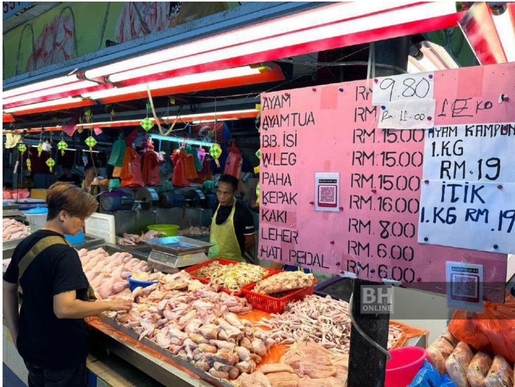
Harga ayam segar di sekitar Johor Bahru naik 30 sen kepada RM9.80 sekilogram, mulai hari ini.

JOHOR BAHRU: Harga ayam segar yang dijual di sekitar bandar raya ini naik 30 sen kepada RM9.80 sekilogram, mulai hari ini, iaitu kenaikan kali ketiga dalam tempoh dua minggu.