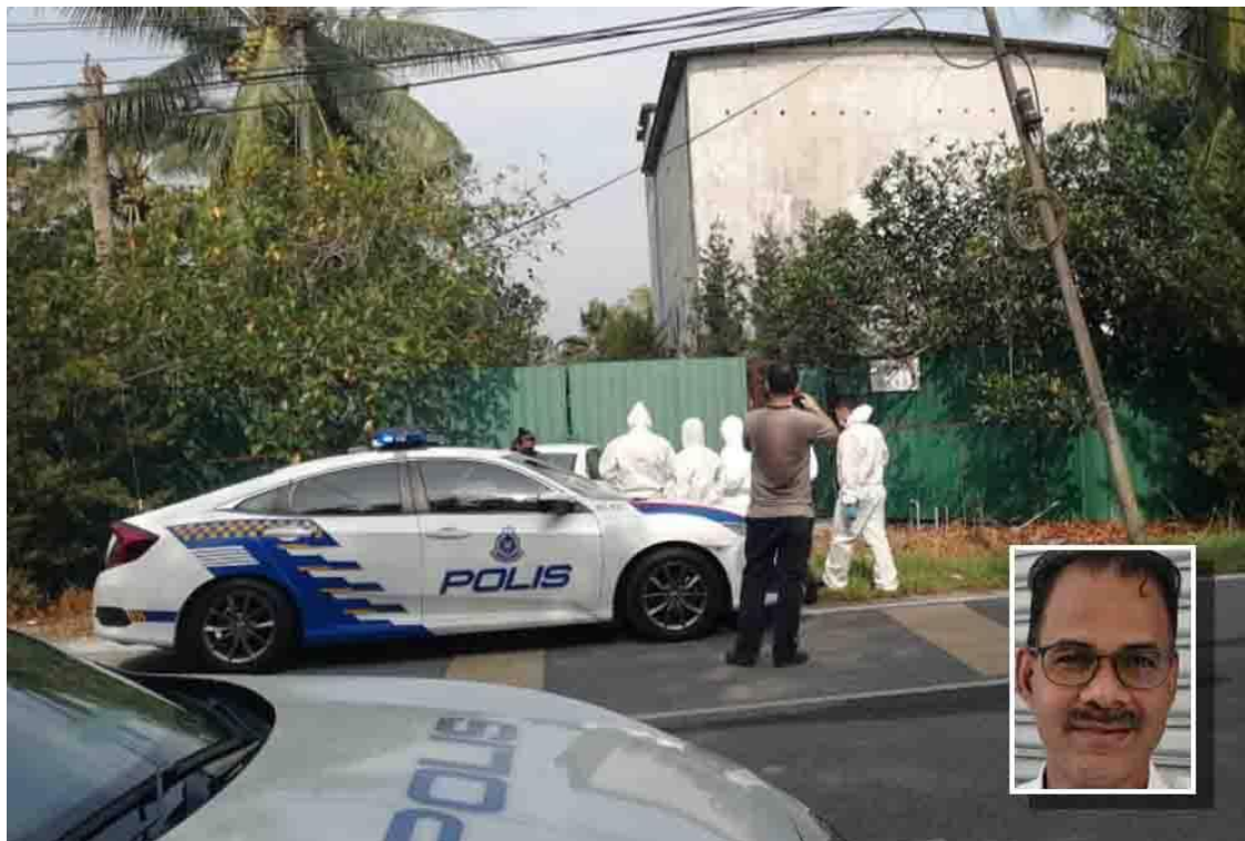
Pegawai DVS melakukan pemeriksaan di ladang ternakan babi Teluk Bunut Banting pada Selasa.