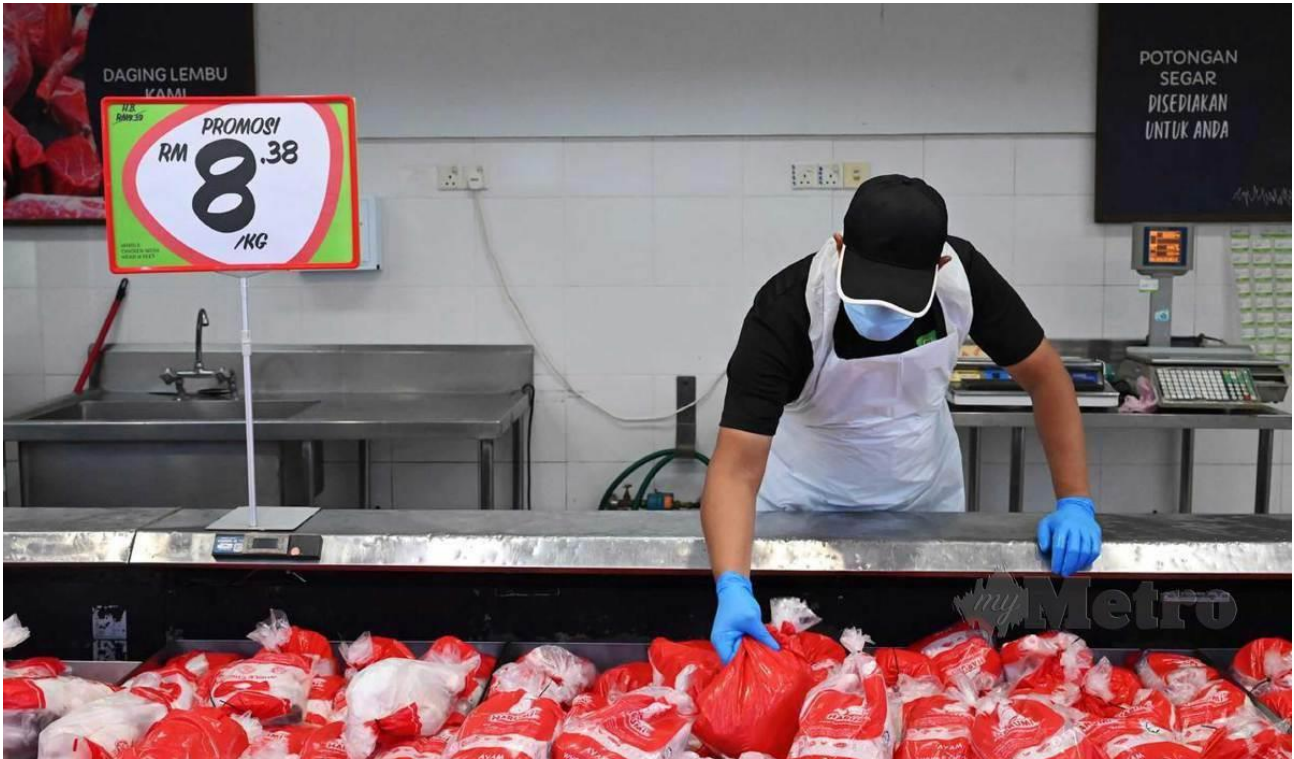
HARGA ayam pada pelaksanaan skim harga maksimum musim perayaan Tahun Baru Cina di Giant Hypermarket Setapak.

Kuala Lumpur: Harga ayam segar di Kuala Lumpur masih lagi stabil walaupun dilaporkan meningkat di beberapa negeri termasuk Johor.