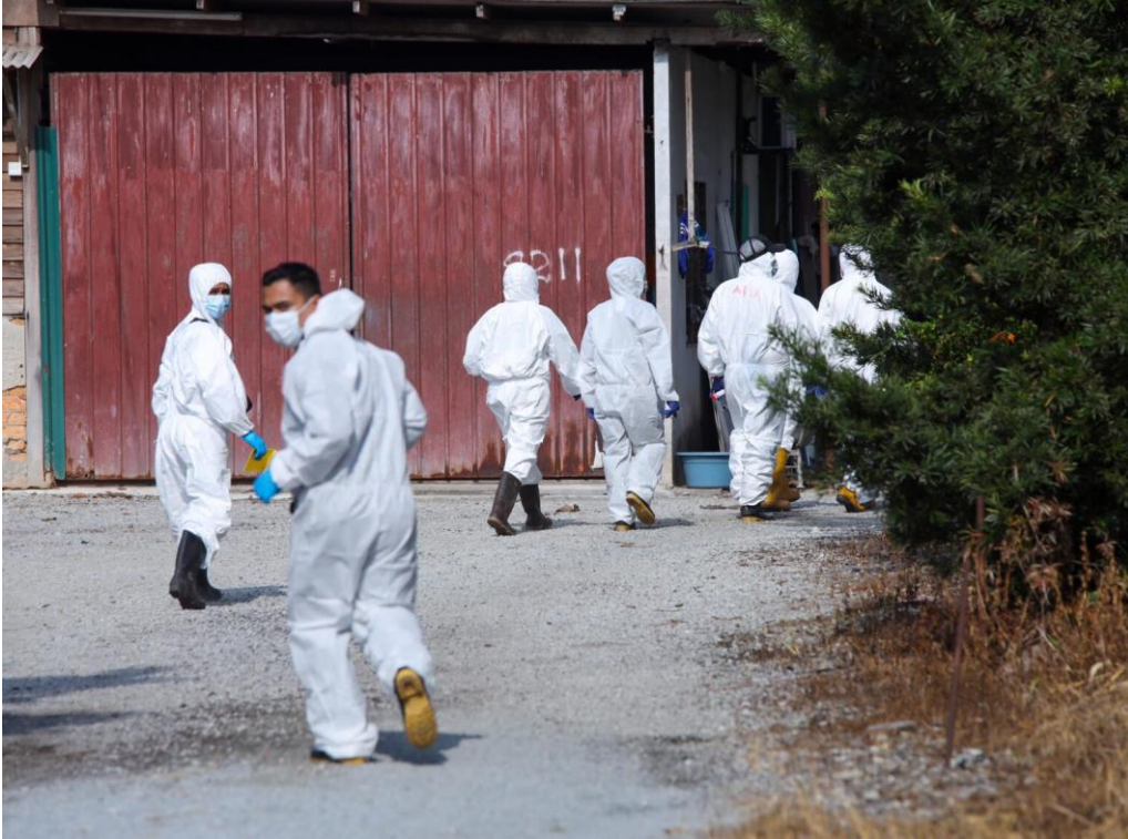
Anggota DVS Selangor memasuki ladang ternakan babi di Teluk Bunut, Kuala Langat.