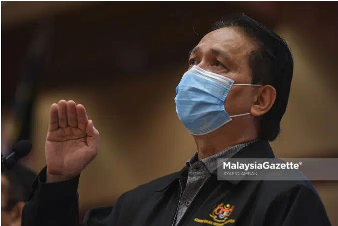
Dr. Noor Hisham Abdullah

KUALA LUMPUR – Kementerian Kesihatan memutuskan semua polymyxins adalah bahan terlarang dalam produk ubat veterinar.