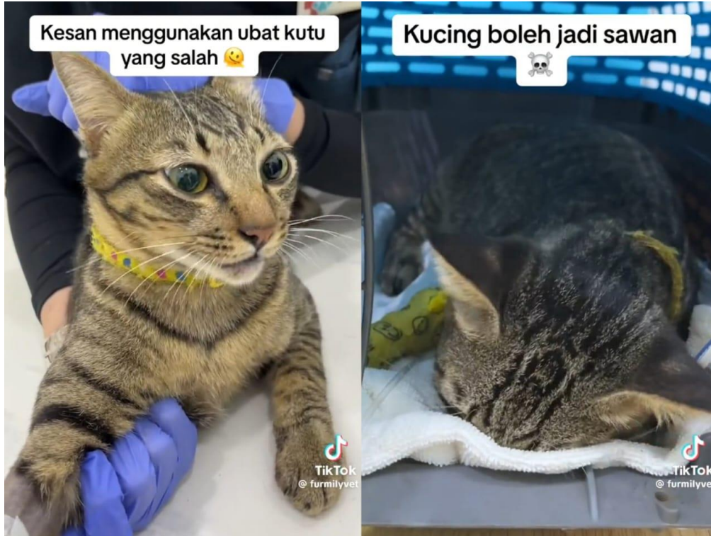
Seekor kucing mengalami sawan selepas didakwa diberikan ubat kutu dibeli dalam talian.

PETALING JAYA – Seekor kucing dengan tiba-tiba mengalami sawan selepas pemiliknya dikatakan memberikan ubat kutu yang dibeli dalam talian.