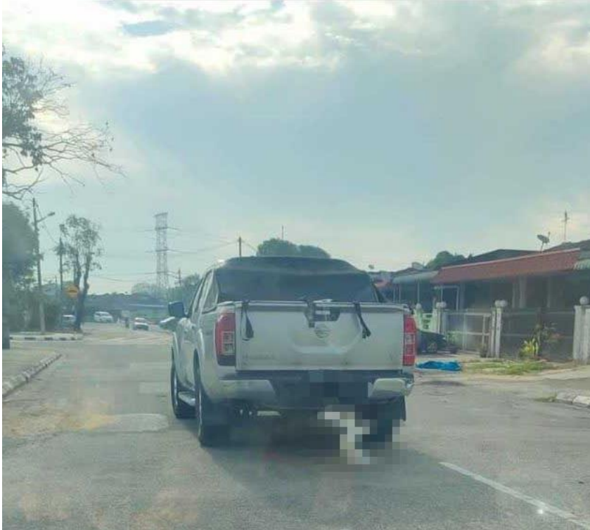
Gambar tular menunjukkan seekor kucing dijerut menggunakan tali sebelum diseret menggunakan pacuan empat roda dalam kejadian di Simpang Ampat, Pulau Pinang.

NIBONG TEBAL – Jabatan Perkhidmatan Veterinar (JPV) Pulau Pinang telah mengambil tindakan susulan video tular menunjukkan seekor kucing dijerut pada bahagian leher sebelum diseret menggunakan sebuah pacuan empat roda dalam kejadian di Simpang Ampat, dekat sini.