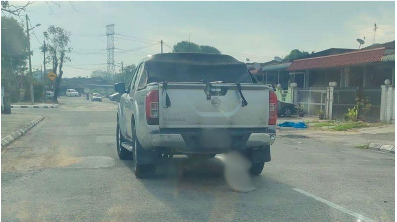
Seekor kucing dijerut pada leher dan diseret dengan sebuah pikap didakwa berlaku di Simpang Ampat di Gerogetown sehingga mendapat perhatian warganet hari ini.

GEORGE TOWN, 8 Ogos: Jabatan Perkhidmatan Veterinar (JPV) Pulau Pinang mengambil tindakan susulan video tular yang memaparkan seekor kucing dijerut leher sebelum diseret dengan sebuah pikap dalam kejadian di Simpang Ampat di sini.