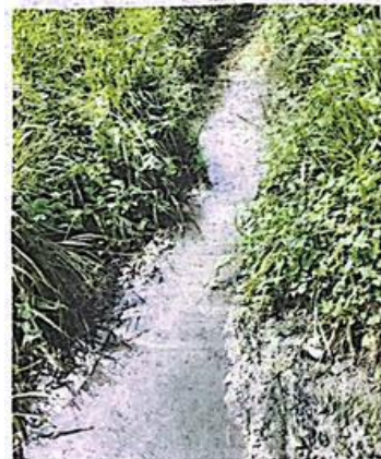
Kesan hitam di tali air berdekatan tapak ladang di Sungai Lembu, Bukit Mertajam Pulau Pinang.