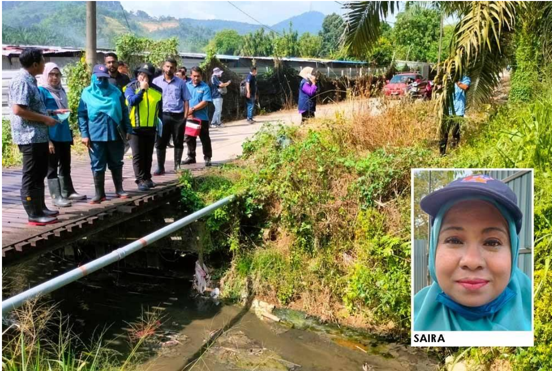
Lawatan turut dilakukan ke tali air yang disyaki mengalirkan sisa kumbahan tanpa kaedah yang betul dari ladang ternakan di Sungai Lembu, Bukit Mertajam, Pulau Pinang.

BUKIT MERTA JAM - Tindakan akan diambil terhadap pengusaha ladang itik yang disyaki menyebabkan pencemaran Sungai Kulim dan Sungai Air Merah di Kedah setelah pemilik memperolehi lesen dari Jabatan Perkhidmatan Veterinar (JPV).