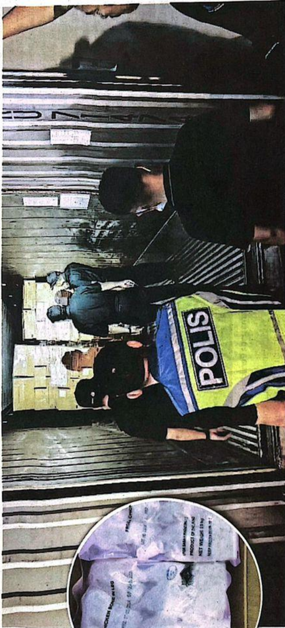
ANGGOTA penguat kuasa melakukan pemeriksaan ke atas sebuah kontena sejuk beku yang menyimpan ayam (dalam bulatan) dan daging babi di Kota Kinabalu pada Selasa lalu.

"Daging babi pula dirampas oleh pihak Jabatan Perkhidmatan Veterinar negeri untuk tindakan lanjut," katanya