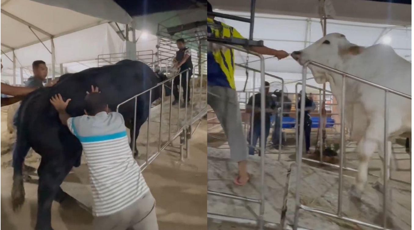
Tangkap layar lembu dan kerbau 'sado' yang dibawa sempena Pameran Pertanian, Hortikultur dan Agro Pelancongan (MAHA) 2024.

PETALING JAYA – Orang ramai mengucapkan terima kasih kepada penternak yang membawa haiwan ternakan khususnya lembu dan kerbau 'sado' sempena Pameran Pertanian, Hortikultur dan Agro Pelancongan (MAHA) 2024.