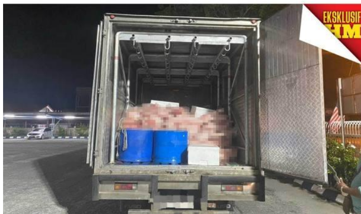
LORI digunakan untuk mengangkut karkas babi ke beberapa negeri seperti Perak, Kuala Lumpur dan Johor untuk dipasarkan.

Tumpat: Pindah karkas (bahagian badan) babi menggunakan perahu melintasi Sungai Golok ketika pihak berkuasa bertukar syif kawalan.